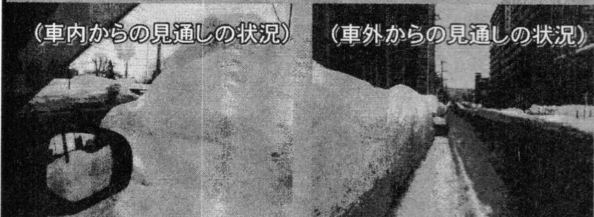
(車外からの見通しの状況)