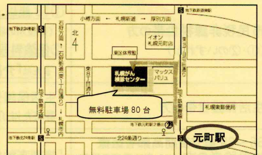
地下鉄東豊線「元町」2番出口から徒歩7分